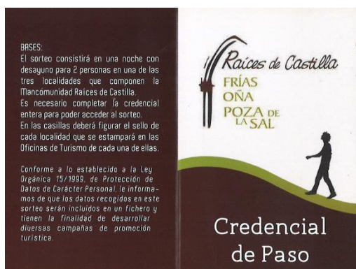
Anverso Credencial de Paso

La credencial es una tarjeta con soporte de cartulina cuyas dimensiones son 11 x 8,5 cm. La imagen es la siguiente: